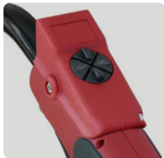
Up/Down-Griff Start/Stop Stromregelung