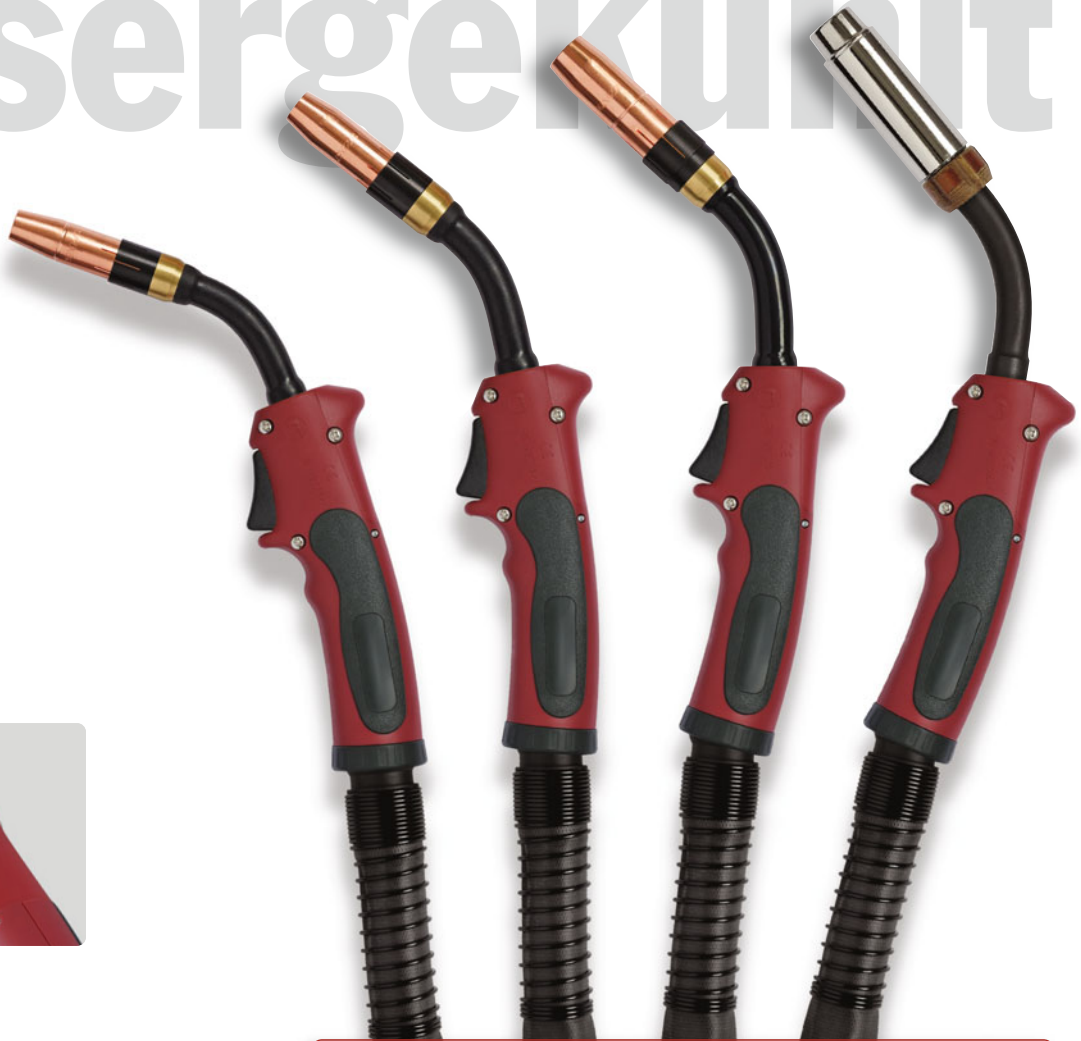
RM 250 W RM 400 W RM 500 W RM 700 W